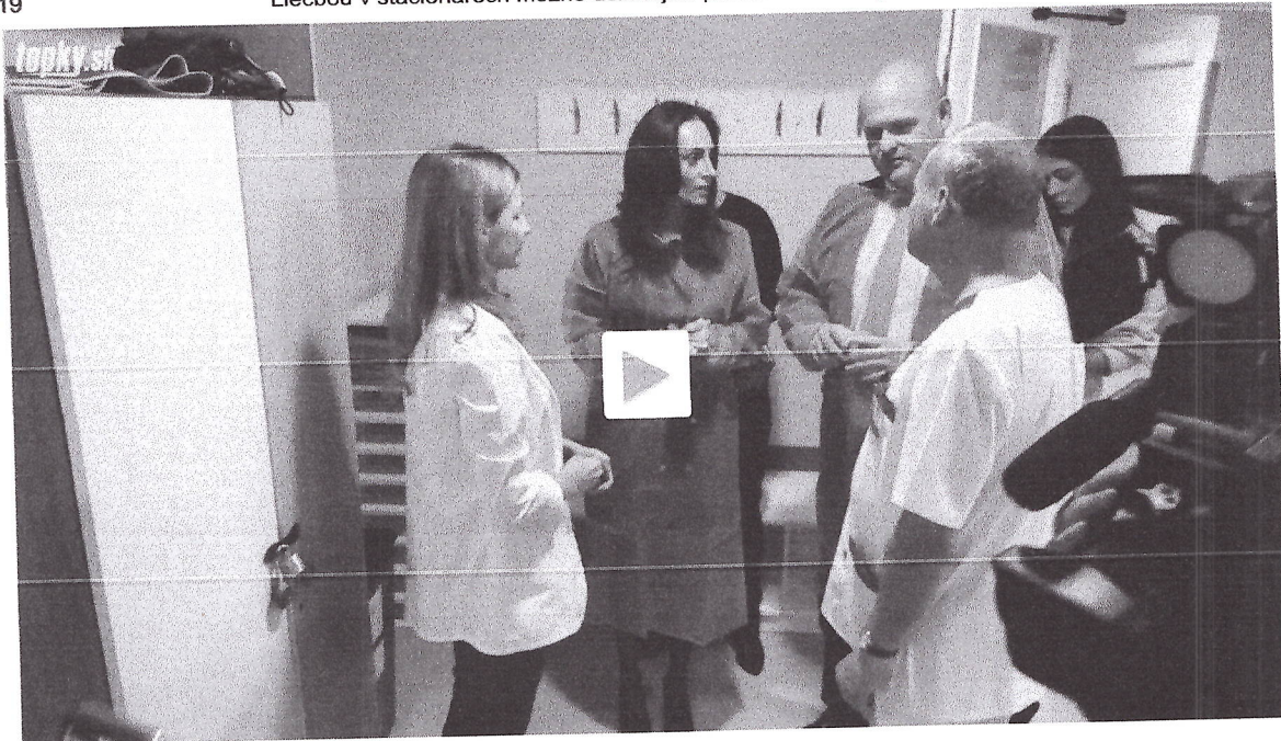
Ministerka zdravotníctva Zuzana Dolínková po návšteve pracovísk Univerzitnej nemocnice Bratislava

"Jednou z tém, ktorým sa musíme intenzívne venovať, je práve starostlivosť o duševné zdravie. Už dnes investujeme veľa energie do skvalitnenia, modernizácie a rozšírenia starostlivosti o duševné zdravie. Z plánu obnovy a odolnosti je pripravených 6,5 milióna eur na rozšírenie siete stacionárov s psychosociálnou rehabilitáciou pre deti a dospelých. Vďaka stacionárom, akým je aj tento, totiž dokážeme účinnejšie predchádzať hospitalizáciám," skonštatovala.