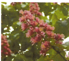
Aesculus carnea "Briotii"