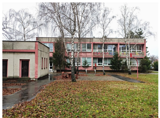
Budova MŠ súp.č.2936, učebný pavilon na p.č.712/4, ul.Komenského, SEREĎ