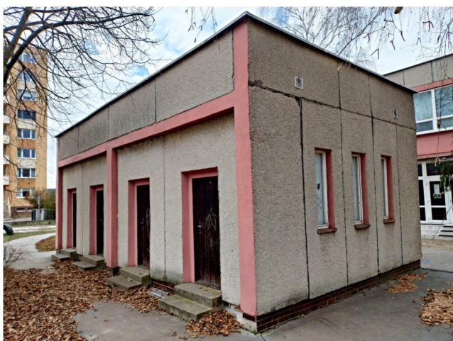
Budova MŠ súp.č.2936, sklad hračiek na p.č.712/5, ul.Komenského, SEREĎ